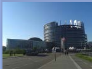
Autorzy : Yves Bertoncini, Thierry Chopin

Jednym z ważniejszych wyzwań wyborów europejskich jest wyznaczenie członków instytucji dysponującej obecnie znaczącymi prerogatywami normatywnymi, budżetowymi i kontrolnymi. Europosłowie będą podejmować decyzje dotyczące wielu wyzwań gospodarczych, społecznych, środowiskowych, politycznych i dyplomatycznych. Yves Bertoncini i Thierry Chopin porządkują wyzwania w trzy wielkie pakiety: wkład UE w wyjście z kryzysu, ewolucja fundamentów konstrukcji europejskiej i strategia dla UE w procesie globalizacji.