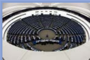
Autorzy : Magali Balent, Corinne Deloy

Perspektywa powiększenia stanu posiadania partii skrajnej prawicy w kolejnych wyborach europejskich w maju 2014 roku podsyca debaty medialne i wywołuje niepokój, że będą one w stanie blokować decyzje w łonie Parlamentu i w konsekwencji funkcjonowanie Unii Europejskiej. By dokonać weryfikacji takiego scenariusza, niniejsze opracowanie analizuje ideologiczną spójność tej "rodziny" politycznej i techniki uwodzenia, jakie stosuje ona w stosunku do opinii publicznej. Służy to dokonaniu bardziej wiarygodnej oceny prawdopodobieństwa podskoczenia jej popularności w wyborach do Parlamentu Europejskiego i stworzenia grupy parlamentarnej, która umożliwiłaby jej większe oddziaływanie w debatach oraz lepszą obronę jej ideałów.