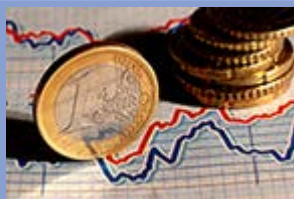
Autor : Philippe Maystadt

27 marca 2014 roku Komisja Europejska przyjęła komunikat w sprawie długoterminowego finansowania europejskiej gospodarki. Fundacja Roberta Schumana publikuje tekst Philippe'a Maystadta, byłego prezesa EBI i specjalnego doradcy Komisji Europejskiej, na temat inwestycji w Europie oraz jej finansowania.