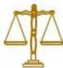
Tabela sprawiedliwości w UE 2014

17 marca 2014 roku Komisja Europejska opublikowała 2. wydanie zestawienia wymiaru sprawiedliwości, którego celem jest promowanie jakości, niezależności i skuteczności systemów sądowych w Unii Europejskiej. Tabela ta jest narzędziem informacyjnym, które służy zaprezentowaniu obiektywnych, wiarygodnych i porównywalnych danych na temat systemów sądowych państw członkowskich. Wersja zastawienia na 2014, będąca kontynuacją pierwszej, opublikowanej w 2013 roku, będzie nadal stanowić dla państw członkowskich Unii Europejskiej instrument sprzyjający efektywności systemów sądowych, a przez to wzrostowi gospodarczemu w Unii. Będzie to zwłaszcza wkład w semestr europejski, który służy poprawie wyników gospodarczych i konkurencyjności państw członkowskich za pośrednictwem rekomendacji dla krajów... Więcej