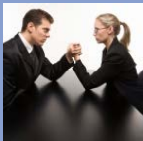
Autor : Pascale Joannin

Z okazji Dnia Kobiet, który przypada 8 marca, Fundacja Roberta Schumana publikuje tekst Pascale Joannin "Europa w rodzaju żeńskim: na rzecz równości w odnowionych w 2014 roku instytucjach Unii". 2014 jest rokiem determinującym dla Europy, ponieważ skład wszystkich instytucji zostanie odnowiony (Parlamentu, Komisji, nowy Wysoki Przedstawiciel do Spraw Zagranicznych, nowy przewodniczący Rady Europejskiej). To dla Unii Europejskiej szansa na zastosowanie postanowień traktatów, które przewidują równość między kobietami i mężczyznami: na oddanie kobietom kierownictwa w 2 z 4 instytucji i 14 na 28 stanowisk komisarzy.