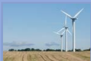
Autor : Grégoire Postel-Vinay

Posiedzenie Rady Europejskiej w dniach 20 i 21 marca poświęcone energii i konkurencyjności przemysłowej Unii, a także paryska konferencja na temat klimatu stwarzają okazje, by pochylić się nad ważnymi, stojącymi przed Unią wyzwaniami związanymi z zapewnieniem jej wzrostu i miejsc pracy. A jednocześnie to szansa na zareagowanie na wyzwania klimatyczne i zwiększoną zależność energetyczną Unii. Poniżej omówiono kilka wyzwań dotyczących zarządzania, międzynarodowych negocjacji, autonomii energetycznej Unii, konsekwencji rewizji reguł konkurencyjności, R&D i postępu technicznego, niepewności energetycznej, specyfik narodowych, taryfowych, produkcji, a także ich wpływ na infrastrukturę oraz bezpieczeństwo zaopatrzenia w świetle ostatnich zdarzeń.