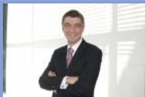
Autor : Andreas Schockenhoff

Z okazji 16. francusko-niemieckiej Rady Ministrów 19 lutego 2014 roku Fundacja Roberta Schumana publikuje wywiad z Andreaszem Schockenhoffem, wiceprzewodniczącym grupy CDU/CSU i przewodniczącym grupy przyjaźni Francja-Niemcy w Bundestagu. Pytany zwłaszcza o kwestie polityki zagranicznej Andreas Schockenhoff opowiada się za nową niemiecką strategią obrony: Niemcy muszą się bardziej zaangażować w rozwiązywanie konfliktów i preferować zamiast "kultury wstrzymywania się" "kulturę odpowiedzialności i pomocy".