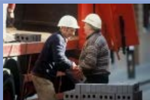
Autor : Sébastien Richard

Sytuacja pracownika oddelegowanego wobec prawa społecznego państwa goszczącego uregulowana jest przez rozporządzenie z 1974 roku, zmodyfikowane w 2004. Utrzymuje ono afiliację pracownika oddelegowanego przy reżimie ubezpieczenia społecznego państwa wysyłającego. Kolejne regulacje to dyrektywa z 1996 roku, która potwierdza stosowanie pensji, czasu pracy i warunków pracy państwa goszczącego, z wyjątkiem sytuacji, gdy normy państwa wysyłającego są bardziej korzystne. Namnożenie się przypadków nadużyć w kontekście częstszego sięgania po delegowanie pracowników od czasu rozszerzenia 2004-2007 roku doprowadziło Komisję Europejską do zaprezentowania projektu dyrektywy wykonawczej mającej zapobiec obchodzeniu dyrektywy z 1996 roku.