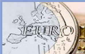
Autor : Dominique Perrut

Reforma unii gospodarczej i walutowej rozpoczęta przez Radę Europejską w czerwcu 2012 roku prezentuje się jako trwała odpowiedź na właściwe euro słabości, które ujawnił ostry kryzys w latach 2010-2012. Rada Europejska w dniach 19-20 grudnia dokona przeglądu tego programu opierającego się na dwóch filarach - unii bankowej i zarządzaniu gospodarczym. Poniższe opracowanie pokazuje decydujące postępy wynikające z tej reformy, a także jej potencjalne słabości.