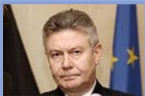
Autor : Karel De Gucht

Z okazji organizowanego przez siebie po raz pierwszy Forum UE-Korea (19 września) Fundacja Roberta Schumana publikuje "Wywiad o Europie" z unijnym komisarzem ds. handlu Karem de Guchtem. Uważa on, że "eksport Unii Europejskiej nadal rośnie w tym samym tempie, co wskazuje, że europejskie przedsiębiorstwa pozostają bardzo konkurencyjne na światowych rynkach".