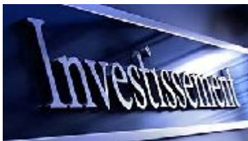
Tabela wyników inwestycji

18 grudnia Unia Europejska opublikowała tabelę wyników inwestycji w badania i rozwój. Po raz pierwszy od 2013 roku europejski przemysł zwiększył swoje inwestycje bardziej niż jego amerykańscy i chińscy konkurenci: o 9,8% w 2023 roku (w porównaniu z 5,9% w Stanach Zjednoczonych i 9,6% w Chinach). W 2023 Unia Europejska zajęła 2. miejsce na świecie pod względem prywatnych inwestycji w badania i rozwój (18,7%), za Stanami Zjednoczonymi (42,3%), ale przed Chinami (17,1%). Wyróżnia się w szczególności inwestycjami w sektorze motoryzacyjnym (w 2023 roku na UE przypadło 45,4% globalnych inwestycji w badania i rozwój w tym sektorze). Więcej - Więcej