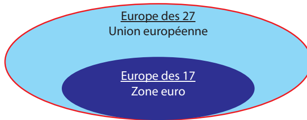
Graphique : Récapitulatif du schéma proposé