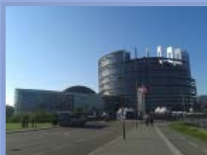
Auteurs : Yves Bertoncini, Thierry Chopin

L'un des enjeux majeurs des élections européennes est de désigner les membres d'une institution disposant désormais de prérogatives substantielles en matière normative, budgétaire et de contrôle. Les élus européens auront à prendre des décisions portant sur de multiples enjeux économiques, sociaux, environnementaux, politiques et diplomatiques. Yves Bertoncini et Thierry Chopin établissent un classement des résolutions en fonction de trois grandes séries d'enjeux : la contribution de l'UE à la sortie de la crise, l'évolution des fondements de la construction européenne et la stratégie pour l'UE dans la mondialisation.