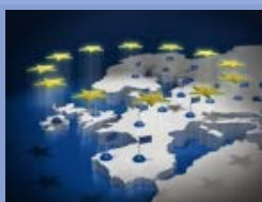
Auteur : Michel Foucher

La Fondation Robert Schuman publie un texte de Michel Foucher, géographe et membre du comité scientifique de la Fondation, sur les intérêts stratégiques des Européens. Afin de "bâtir un pôle de puissance et d'influence" dans un monde polycentrique, l'Europe doit compter sur ses intérêts stratégiques. Ces zones peuvent représenter des intérêts économiques (énergie) mais aussi politiques (conflits, terrorisme, immigration). Ce texte est issu du "Rapport Schuman sur l'Europe, l'état de l'Union 2013" publié aux éditions Lignes de repères. L'ouvrage est disponible à l'achat sur notre site dans notre rubrique "Librairie".