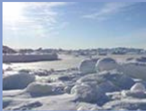
Auteur : Damien Degeorges

Les conséquences du changement climatique ont conduit ces dernières années à un intérêt accru des grandes puissances pour l'Arctique. L'enjeu n'est plus seulement climatique, mais également économique et stratégique. L'Arctique s'affirme en tant que nouvelle frontière des relations internationales, entre intérêts américains, européens et asiatiques. L'Union européenne, acteur régional, a la possibilité de faire valoir ses atouts, si elle sait s'en donner les moyens. Le renforcement de sa relation avec le Groenland, territoire clé des futurs développements dans l'Arctique, est un enjeu majeur pour l'Union européenne.