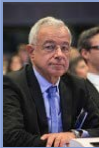
Auteur : Alain Lamassoure

Les négociations sur le budget européen font rage. Le budget 2012 n'est pas bouclé, les négociations pour le budget 2013 sont au point mort, et celles sur le Cadre financier pluriannuel font l'objet d'âpres discussions entre les institutions européennes, et entre les Etats membres. Alain Lamassoure (PPE, FR), Président de la commission des Budgets du Parlement européen, nous livre dans cet Entretien son interprétation de la situation.