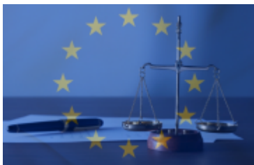
Tableau de bord de la justice

Le 4 juin, la Commission européenne a publié la 14ème édition du tableau de bord de la justice dans l'Union européenne. L'édition 2026 fait état d'une perception améliorée de l'indépendance judiciaire et de progrès continus dans la numérisation des systèmes de justice dans les 27 Etats membres. Pour la première fois, le rapport présente un panorama des compétences des plus hautes juridictions administratives et des juridictions ordinaires des Etats membres en matière commerciale. Les conclusions du tableau de bord serviront à alimenter le rapport 2026 de la Commission sur l'état de droit et le semestre européen. Lire la suite - Autre lien