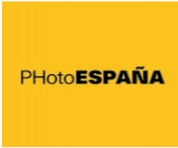
Photo à Madrid

Jusqu'au 13 septembre, la ville de Madrid accueille la 29e édition du festival Photo Espana. Événement de référence des arts visuels et de la photographie, il propose de découvrir les dernières tendances à travers des expositions dans les principaux musées, salles et galeries d'art de la capitale espagnole. Sous le thème "réimaginer", cette édition met l'accent sur la créativité photographique, l'expérimentation et l'exploration des limites de l'image, tout en interrogeant le réel et l'autorité. Lire la suite