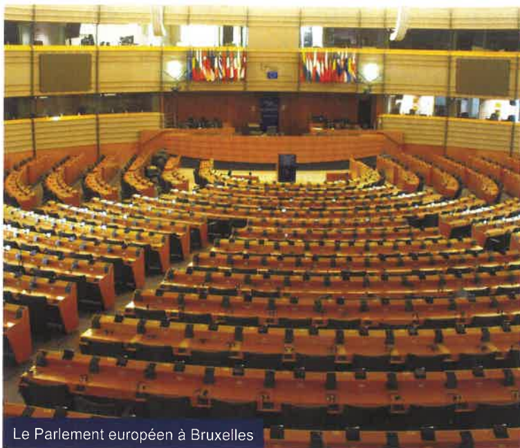
Le Parlement européen à Bruxelles

Pour autant, au regard de la carte électorale dans les Etats membres à ce jour, et avec les réserves d'usage, cela ne devrait pas remettre en cause la physionomie politique du Parlement et les conditions de formation d'une majorité.