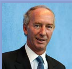
Autor : Jean-Dominique Giuliani

¿Cómo mejorar rápidamente el funcionamiento de las instituciones europeas? El Presidente de la Fundación Robert Schuman, Jean-Dominique Giuliani, tratará de responder a esta pregunta. Su aportación se basa en la convicción de que la construcción europea sigue siendo más pertinente que nunca pero que hay que revisar sus formas de actuación; se pretende que sea más concreta: ¿que se puede mejorar en el funcionamiento de las instituciones comunes, con los tratados actuales, con medidas rápidas susceptibles de dar respuestas significativas a las múltiples y diversas expectativas que se manifiestan ahora públicamente con respecto a "Bruselas", denominación por desgracia a menudo despectiva, cómoda y confusa? Sólo se necesita el compromiso personal del futuro presidente de la Comisión, del nuevo Parlamento en lo que le concierne y de los Estados miembro para el Consejo. El Consejo europeo de los días 26 y 27 de junio de 2014, en busca de una reactivación, podría, conforme a su misión, dar la señal y trazar las perspectivas.