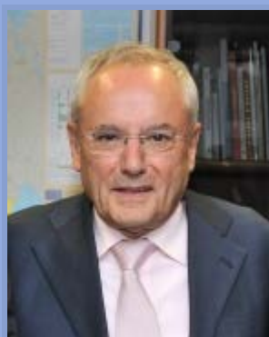
Autor : Jacques Barrot

La Fundación Robert Schuman publica una "entrevista de Europa" a Jacques Barrot, antiguo vicepresidente de la Comisión europea y miembro del Consejo de administración de la Fundación. Interrogado sobre el drama de Lampedusa, éste considera que es "el de una Europa que no es bastante solidaria con sus Estados miembro periféricos". En estos tiempos de populismo en el que los Estados miembro pueden verse tentados a cerrar sus fronteras, Jacques Barrot aboga para que "no se cuestione la política de libre circulación de los ciudadanos europeos".