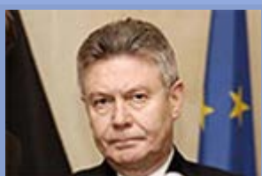
Autor : Karel De Gucht

La Fundación Robert Schuman publica una entrevista realizada al Comisario europeo de comercio, Karel de Gucht. En su opinión "un acuerdo (comercial) con los Estados Unidos puede ayudar a salir de este callejón sin salida. Los Estados Unidos expresaron sus dudas en cuanto a la inclusión de cuestiones reglamentarias en los servicios financieros, pero a estas alturas el tema sigue discutiéndose. Uno de los principales objetivos de la negociación es lograr que las empresas europeas no sigan sometidas a la aplicación de la legislación "Buy American". Añade que (tras) "el acuerdo con Corea del Sur, nuestras exportaciones aumentaron más de un 16 % en un año, ofreciendo a la Unión Europea una balanza comercial positiva con este país por primera vez desde hace 15 años. Si concluyéramos todos los acuerdos que están en fase de negociación podríamos aumentar el PIB europeo un 2,2%"