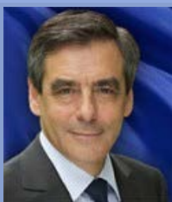
Autor : François Fillon

Ahora que Francia hace público su "Libro Blanco sobre la defensa", la Fundación Robert Schuman propone el texto del discurso de François Fillon, ex-Primer ministro francés, sobre los retos de la defensa europea, pronunciado el 25 de abril de 2013 en la conferencia sobre la seguridad europea que se celebró en Berlín a iniciativa de la Munich Security Conference.