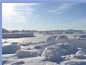
Autor : Damien Degeorges

Las consecuencias del cambio climático han suscitado estos últimos años un interés creciente de las grandes potencias por el Ártico. Lo que está en juego no es únicamente el clima, sino que también es un reto económico y estratégico. El Ártico se confirma como nueva frontera de las relaciones internacionales, entre intereses americanos, europeos y asiáticos. La Unión Europea, actor regional, tiene la posibilidad de hacer valer sus puntos fuertes si logra sacar provecho de sus medios. El refuerzo de su relación con Groenlandia, territorio clave de los futuros desarrollos en el Ártico, es un reto importante para la Unión Europea.