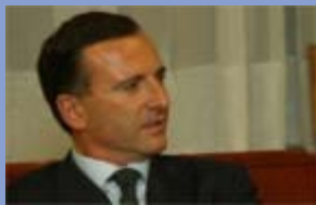
Autor : Franco Frattini

Después de una declaración liminar sobre la historia de la integración europea y la naturaleza política, desde el principio, del proyecto europeo, Franco Frattini aborda tres cuestiones fundamentales para el futuro. A propósito de la crisis de la deuda, insiste en el hecho de que los fundamentos económicos de la zona euro son sólidos y que los temores expresados por los mercados son económicamente poco racionales. Evoca luego los desafíos a los que se enfrenta la Unión en la escena mundial. Por último, la "primavera árabe" ha recordado a Europa su vecindad inmediata con el espacio mediterráneo. Se enfrenta a nuevos desafíos a los que debe responder con voluntad política y espíritu de cooperación.