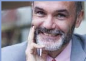
Autor : Jean-Pierre Filiu

Tras la celebración de las primeras elecciones democráticas en Túnez, la Fundación Robert Schuman publica un Entretien d'Europe a Jean-Pierre Filiu. Este artículo aparece con motivo de la publicación de su última obra "La Révolution arabe, dix leçons sur le soulèvement démocratique". En esta entrevista, Jean-Pierre Filiu ahonda en estas rebeliones democráticas que han afectado tanto al mundo árabe.