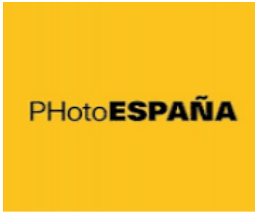
Foto in Madrid

Bis zum 13. September findet in Madrid die 29. Ausgabe des Festivals "Photo Espana" statt. Als führende Veranstaltung für bildende Kunst und Fotografie bietet es die Möglichkeit, die neuesten Trends anhand von Ausstellungen in den wichtigsten Museen, Ausstellungsräumen und Kunstgalerien der spanischen Hauptstadt zu entdecken. Unter dem Motto "Neu denken" legt diese Ausgabe den Schwerpunkt auf fotografische Kreativität, Experimentierfreudigkeit und die Erforschung der Grenzen des Bildes, während sie gleichzeitig die Realität und Autorität hinterfragt. Fortsetzung